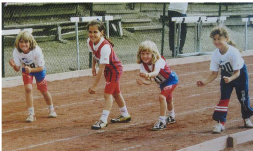
Friidrotten hade under 1990-talet en stark ungdomsverksamhet.