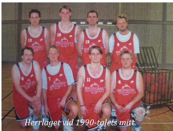
Herrlaget vid 1990-talets mitt.

Efter bygget av Utrikeshallen fick basketen en boom i sin verksamhet med fler ungdomar och ett allmänt ökat intresse. Som kronan i verket var Jämtland Ambassadors träningsläger och