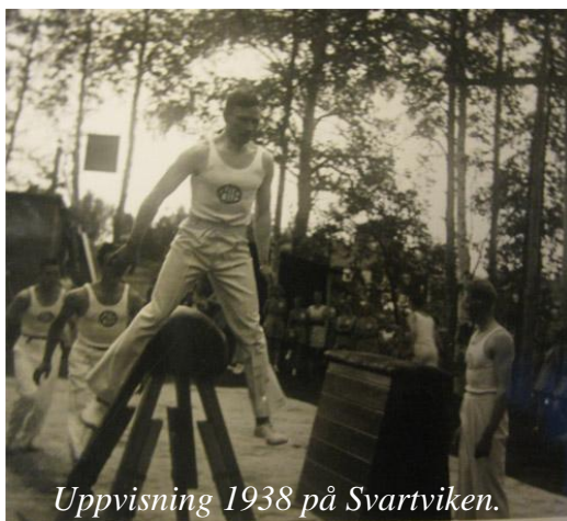
Uppvisning 1938 på Svartviken.

Gymnastiken hade i början enbart en tävlingsinriktad verksamhet även om sektionen senare skulle komma att rikta in sig på motionsidrott. Innan dess hade gymnastiksektionen stått för en mycket lyckosam och populär tävlingsinriktad verksamhet där föreningen blev riktigt